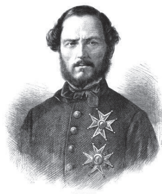
Juan Prim, 1860-ban (Rufino Casado litográfiája, Biblioteca Nacional de España)

Az 1833–1874 közé eső években a liberális pártok átveszik a politikai életben az irányítást Spanyolországban. Különböző áramlatok jelennek meg: mérsékelték (valójában a konzervatívokra használt fogalom), progresszisták, unionisták, amelyek különféle megoldásokat képviselnek, és megjelenik – a század közepe felé egyre erőteljesebben – a demokrata és a republikánus (beleértve a föderalista változatot), sőt az ibér uniós (Spanyolország és Portugália föderációját támogató) gondolat