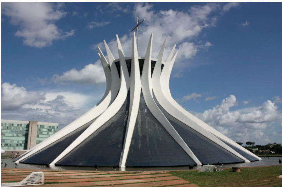
3. kép. Catedral Metropolitana Nossa Senhora Aparecida (Brazíliaváros)

Niemeyer számos reprezentatív középületet tervezett a fővárosban: a Nemzeti Színház (1957), az elnöki palota ( Palácio da Alvorada , 1959), parlament (1960), Igazságügyi Palota ( Palácio da Justiça , 1960), ám az egyik leghíresebb, leginkább emblemikus, legtöbbet fényképezett műve talán a főváros, Brazíliaváros jelképének számító katedrális: a Catedral Metropolitana Nossa Senhora Aparecida , melynek építése 1959-ben kezdődött el, ám csak 1970-ben fejezték be és szentelték fel. Érdekes kérdés, miképp lehetséges, hogy Fidel Castro barátjának, egy bevallottan ateista, élete nagy részében kommunista építésznek épp egy katedrális az egyik legismertebb műve – ahogyan az is, miképp szimbolizálhat egy kommunista utópia nevében fogant fővárost egy székesegyház.